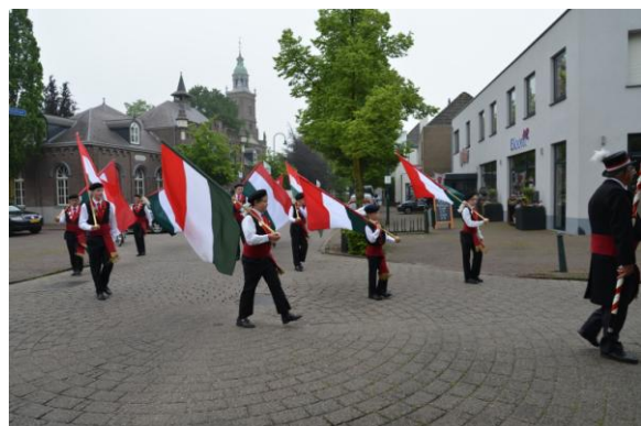
Op weg naar de Mariakapel.