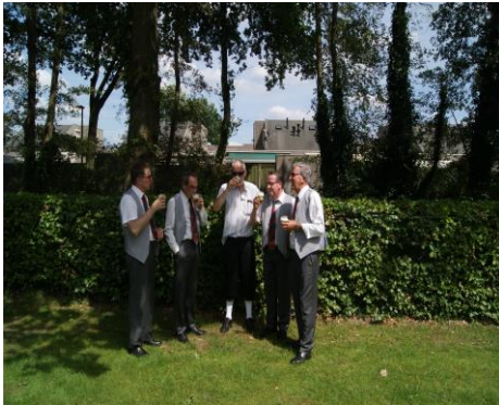
Het bestuur in beraad over de nieuwe koning (omkoopbiertje van de nieuwe koning?)

De aanwezigen hebben na de installatie van de koning genoten van een Chinese maaltijd en verbleven nog een aantal fijne uren op het gildeterrein.